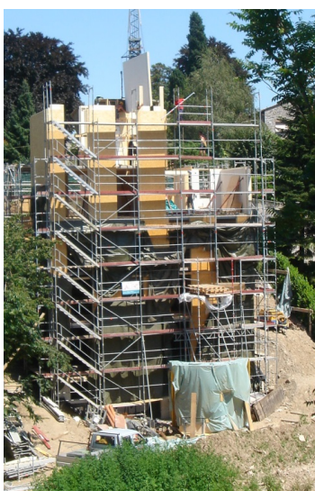
Fasi di montaggio