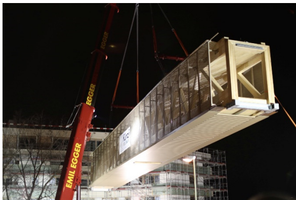
Fase di montaggio