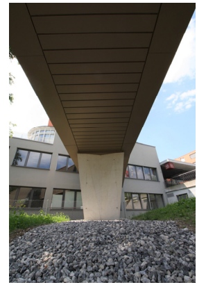
Vista pilastro portante